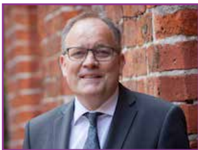
Biskop, Elof Westergaard