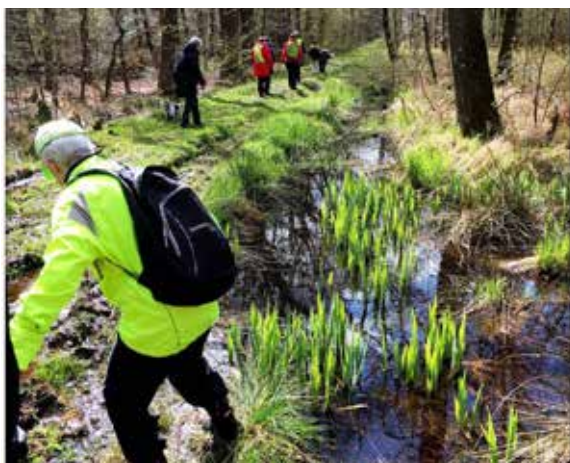
Husk praktisk tøj og solidt fodtøj